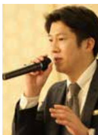
株式会社クリエイティブセントラル 代表取締役 マーケター 集客戦略コンサルタント 1981年生まれ、福岡在住