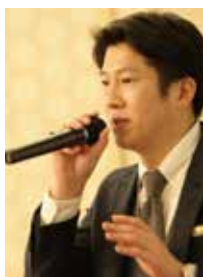
株式会社クリエイティブセントラル 代表取締役 マーケティング 集客戦略コンサルタント 1981年生まれ、福岡在住